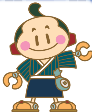
松阪商人サポート隊キャラクター 豪商あっせいくん