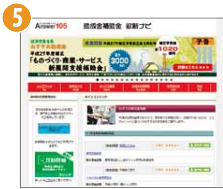
[Answer105] 助成金補助金 診断ナビ TOP画面