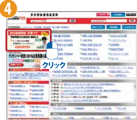
[Answer105] デジタル法令＆文例画面