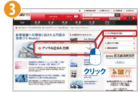
[Answer105] サービスメニュー画面