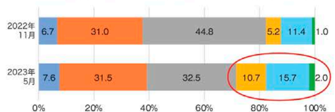
■消費者の最近の消費意識・行動の変化（三重県）