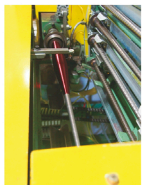
燃られる前の原料糸

現在、同社がつくる無結節網は陸上用が8割、漁網用が2割を占める。多くの製網会社が漁網を主力製品としてきた中、同社は早くからスポーツ用ネットに取り組み、約50年の実績がある。創業者のこのような思い切った決断が功を奏することとなる。1990年代に入ると、有結節タイプの漁網を使用する一部の漁法が世界的に禁止となったためだ。これがきっかけとな