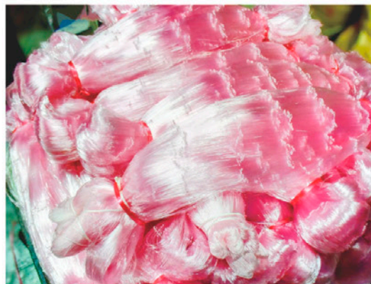
創業当時から製造している沿岸用雑刺網

近年、ゴルフ場や球場のグラウンドネット、サッカーのゴール用ネット、テニスコート用ネットなどが有結節網から無結節網に代わっていることにお気づきだろうか。同社はスポーツ用の無結節網の生産量が多い。