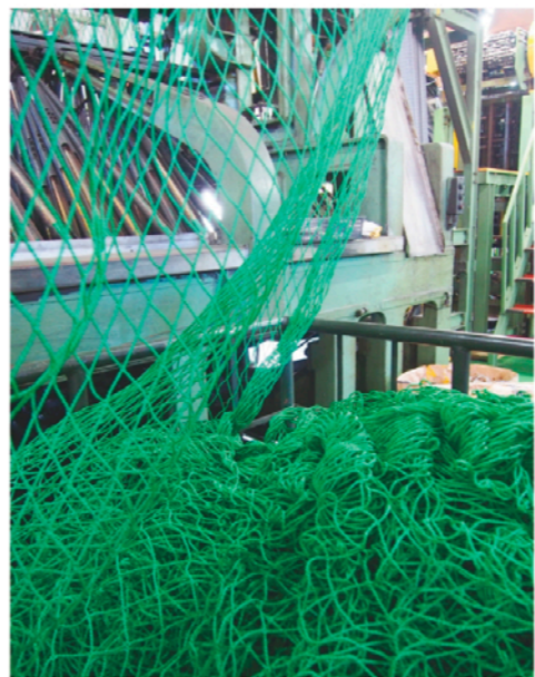
スポーツ用ネット

真摯なものづくりへの態度は、扱う素材にもあらわれている。スポーツ用ネットは長年、再生利用可能なポリエチレン製を中心に扱ってきた。今後は「リサイクル素材を使った網地の製造にも挑戦したい」と抱負を語る。