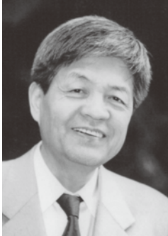
【講師】田原総一郎氏

1934年滋賀県彦根市生まれ。早稲田大学文学部卒業後、岩波映画製作所、テレビ東京を経て、'77年フリーに。現在は政治・経済・メディア・コンピューター等、時代の最先端の問題をとらえ、活字と放送の両メディアにわたり精力的な評論活動を行っている。テレビ朝日系で'87年より『朝まで生テレビ』（毎月最終金曜25：20～28：20）、'89年より2010年3月まで『サンデープロジェクト』に出演。'05年4月より早稲田大学特命教授を務める。