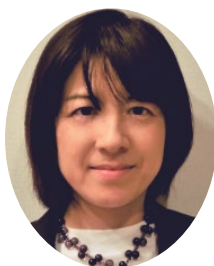
高田短期大学 キャリア研究センター研究員