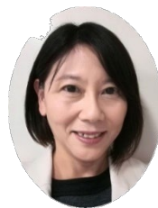
高田短期大学 キャリア研究センター研究員