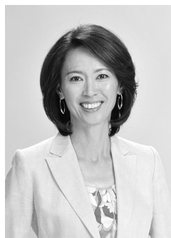
有森 裕子氏 (元マラソン選手)