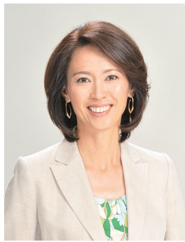
[講師] 有森 裕子氏 (元マラソン選手)

オリンピックで2大会連続メダル獲得という輝かしい経歴の背景には、ランナーとしてのみならず、“人としての生き方”を常に真摯に追い求めてきた、強い信念があった。引退後も、スポーツ界全体の発展や、障害者スポーツの普及活動などのために、精力的な活躍を続ける有森氏に、その想いを叶えていく原動力について、お話ししていただきます。