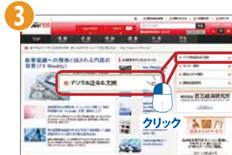
[Answer105] サービスメニュー画面