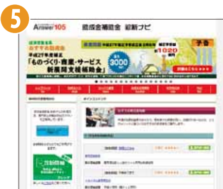
[Answer105] 助成金補助金 診断ナビ TOP画面