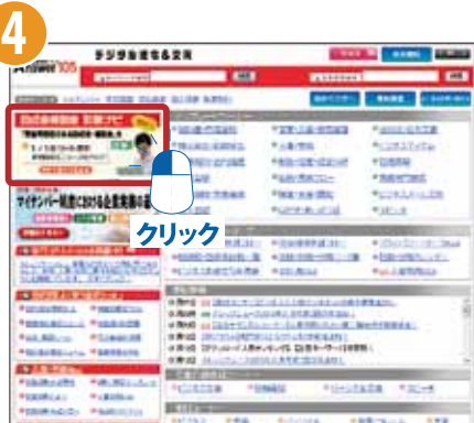
[Answer105] デジタル法令＆文例画面