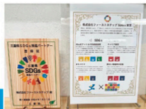
三重県SDGs登録証 推進パートナー