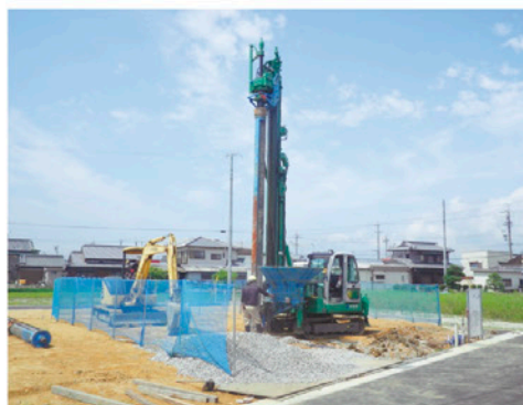
エコジオZERO工法(無排土タイプ)

建設地の地盤を強固にするために行う地盤改良では、一般的にセメント系固化材や鉄の杭など様々な人工物を地中に埋め込むが、年月と共に劣化する可能性がある。またセメント系固化材から発がん性物質が流れ出す恐れが指摘されている。土壌汚染や地中に残ったセメント改良土や